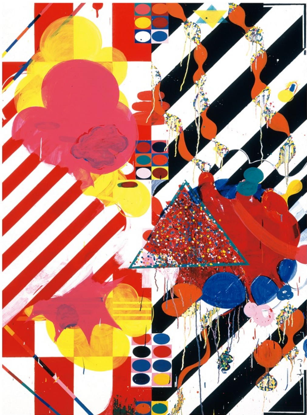
山崎つる子《作品》1964年 ラッカー、布 芦屋市立美術館蔵